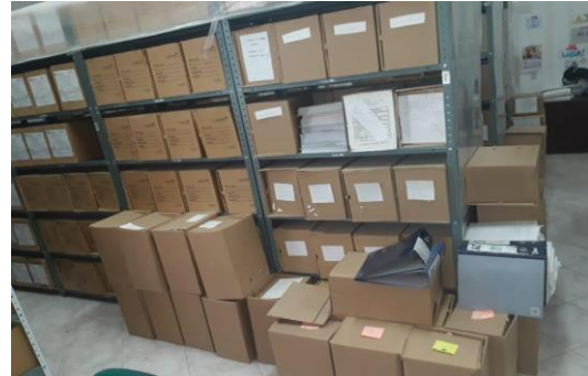
Ilustración 3. Archivo Central ESE MANUEL CASTRO TOVAR 2018

El archivo central cumple como depósito de documentos, está organizado y se tiene un inventario documental que permite la ubicación y localización de un documento que se encuentre registrado en dicho inventario.