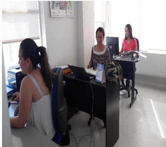
Ilustración 5. Archivos de Gestión ESE MANUEL CASTRO TOVAR

Como ya se había mencionado es evidente la orientación de la alta dirección al cumplimiento de la función archivística sobre todo después del 2016, Y AHORA QUE LA Entidad cuenta con certificación de calidad.