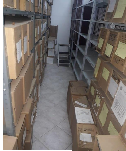
Ilustración 4. Registro fotográfico Archivo central ESE MANUEL CASTRO TOVAR